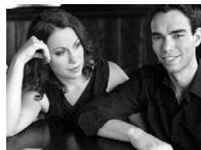
Violinduo „The Twiolins“